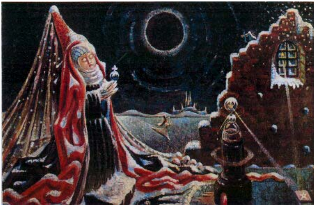
La Pierre Philosophale